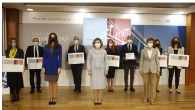
Las personas premiadas junto a las autoridades, durante la entrega de premios.

Representantes del espectro social, empresarial y universitario han celebrado esta mañana la XXIV edición de los premios Universidad-Sociedad que otorga el Consell Social de la Universitat de València (UV), que reconoce a personas, entidades y empresas que trabajan por exportar el conocimiento de las aulas a la sociedad a través de la investigación y el tejido empresarial valenciano. Gente que, como se ha explicado Silvia Tomás, presentadora del acto y periodista de Levante TV durante la gala "hace un trabajo extraordinario que merece un reconocimiento público". Se trata de una entrega que corresponde a la edición de 2020 pero que no pudo realizarse por la pandemia.