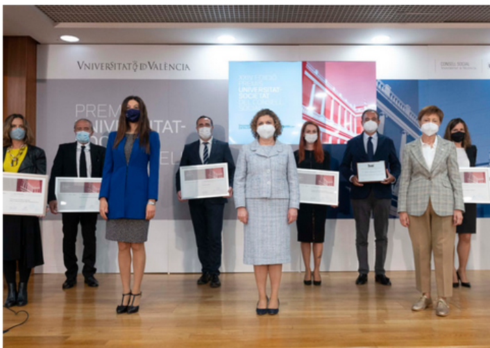
Imatge dels premiats i les autoritats presents.

Ford España, en la categoria de Mecenatge Empresarial; el Projecte InAdvance, del Instituto Polibienestar de la Universitat de València, en la modalitat d'Impacte Social; i la Fundació Col·legi Imperial Xiquets Orfes de Sant Vicent Ferrer, en la categoria d'Accions Humanitàries, són els guardonats en els XXIV lliurament dels Premis Universitat-Societat del Consell Social de la Universitat de València.